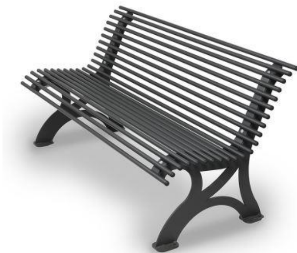
Foto – modello panchina.